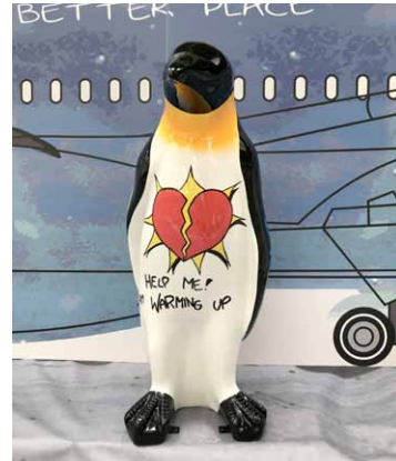
PINGUIN / PENGUIN 120 CM - Hannes D'Haese - Limited Series - € 3 000