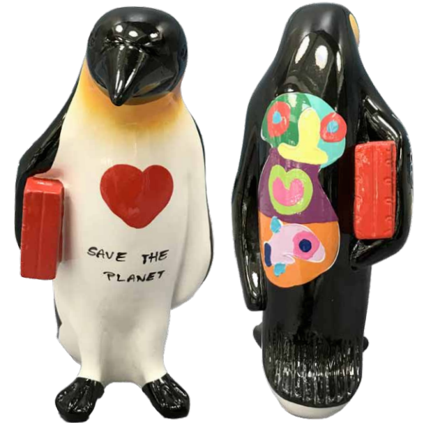
PINGUIN / PENGUIN 30 CM Hannes D'Haese - Limited Series - € 200

THE PENGUIN FAMILY MAKES EVERYBODY SMILE