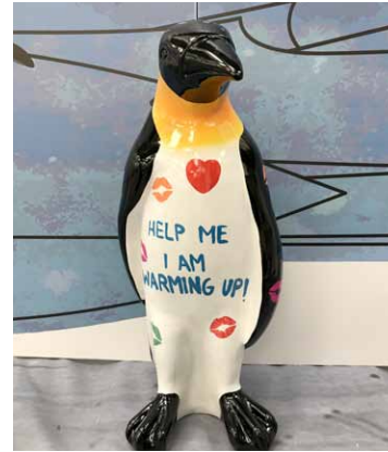
PINGUIN / PENGUIN 95 CM - Hannes D'Haese - Limited Series - € 2 500