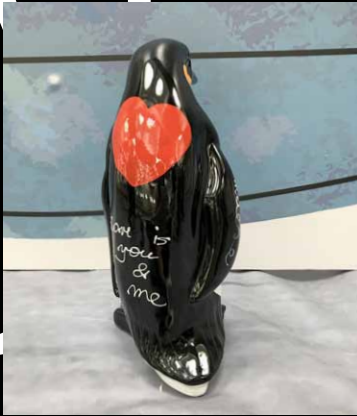
PINGUIN / PENGUIN 40 CM - Hannes D'Haese - Limited Series - € 400