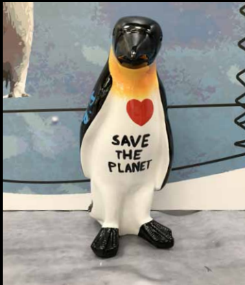
PINGUIN / PENGUIN 67 CM - Hannes D'Haese - Limited Series - € 1 800