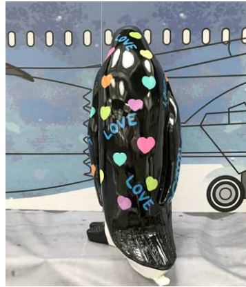
PINGUIN / PENGUIN 120 CM - Hannes D'Haese - Limited Series - € 3 000