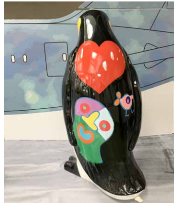
PINGUIN / PENGUIN 180 CM - Hannes D'Haese - Limited Series - € 10 000